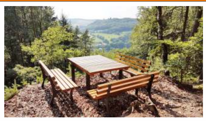
Schützenbrunnen - Brunnen- und Rastanlage

Eine von 28 Rastgelegenheiten mit toller Aussicht